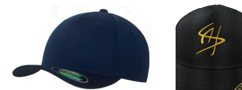
CAPPELLINO CON VISIERA LOGO SAI ORO