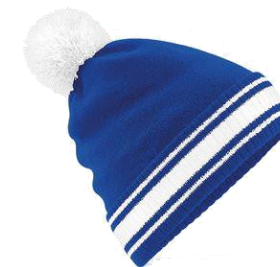
CAPPELLINO LOGO SAI ORO